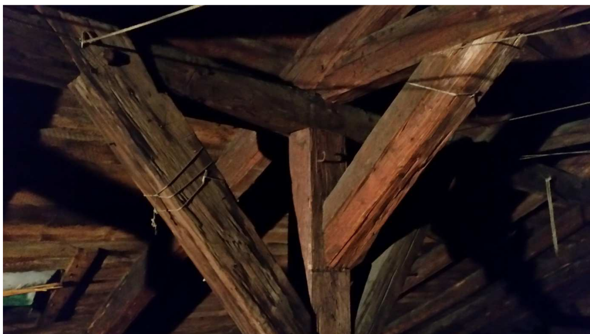
Fot nr 6. Widok rozwarstwionych i spękanych zastrzałów.