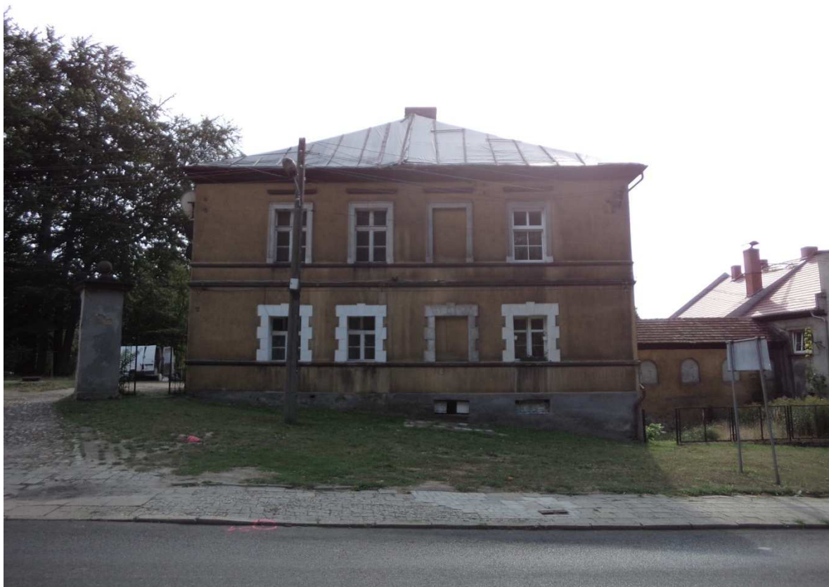
Fot nr 15 Widok elewacji północnej.