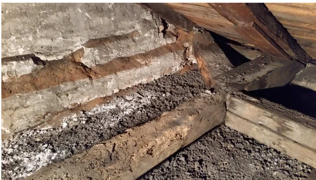
Fot nr 10 Widok skorodowanych biologicznie tram.