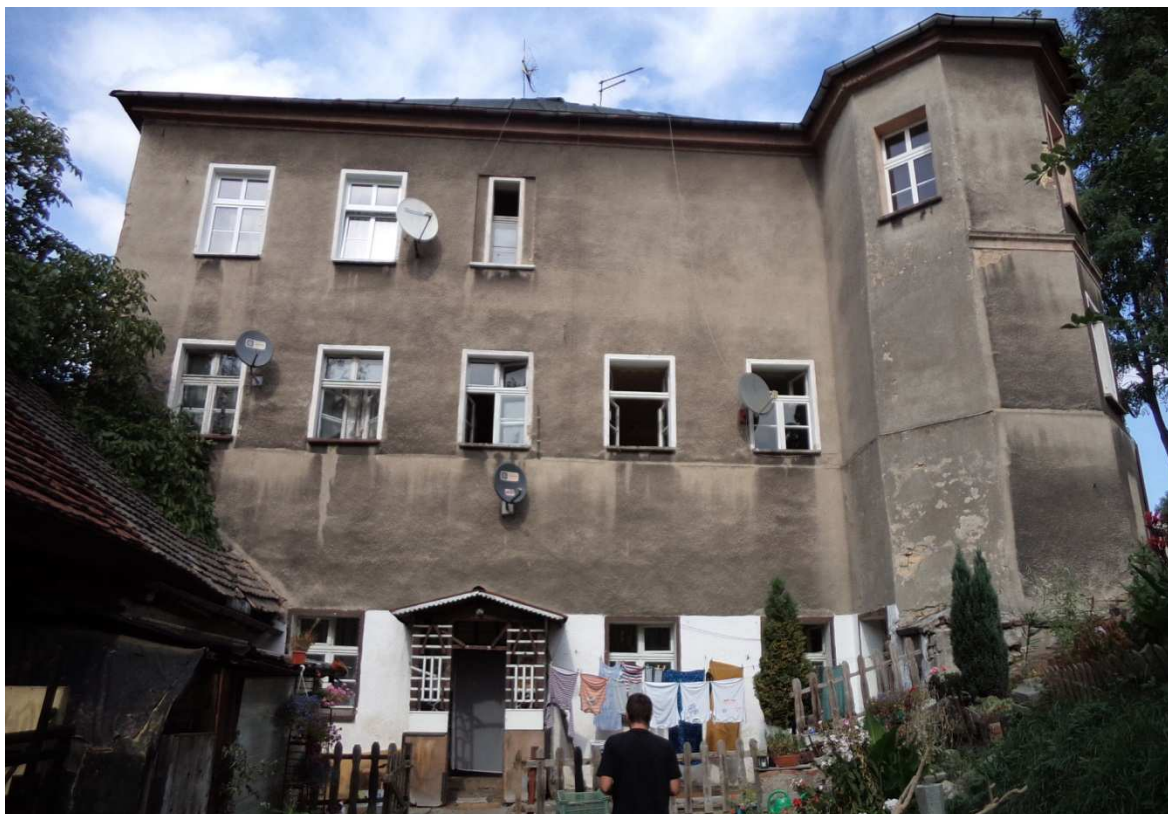
Fot nr 19 Widok elewacji południowej.