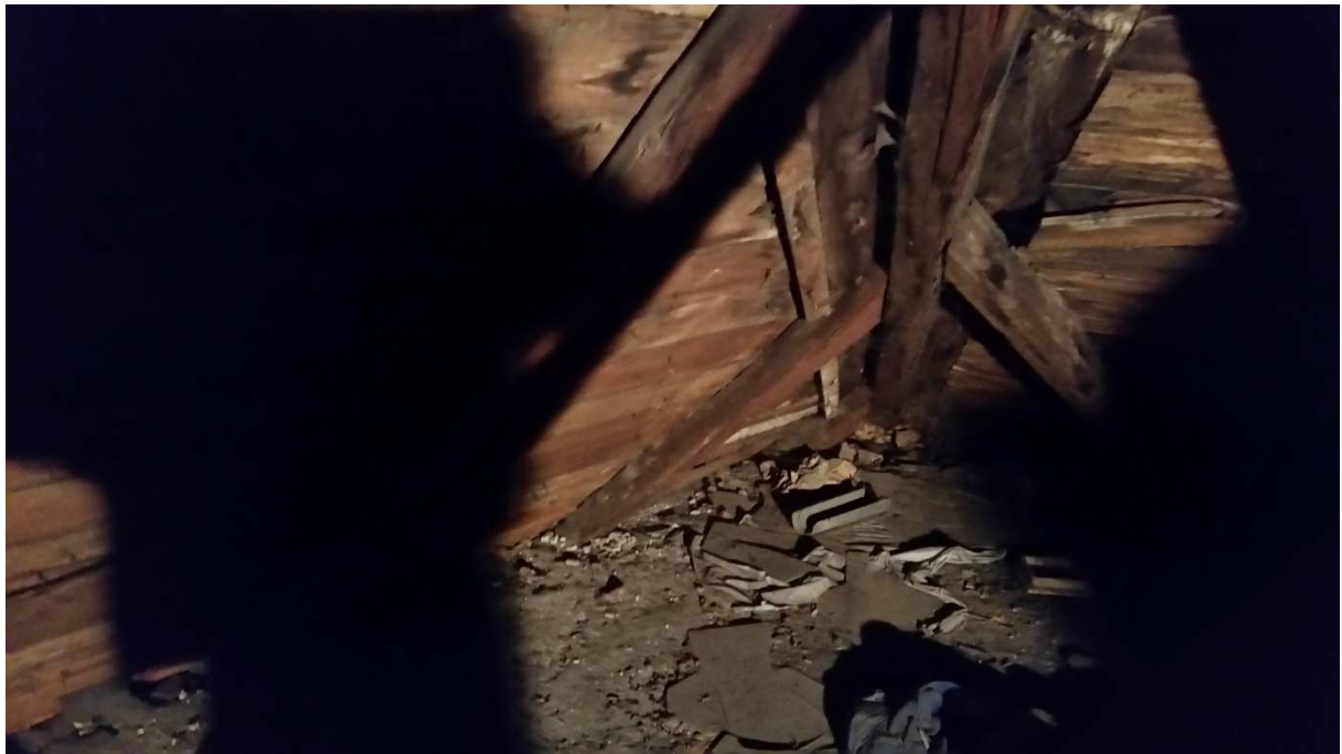
Fot nr 3 Widok zawilgoconej krokwi koszowej