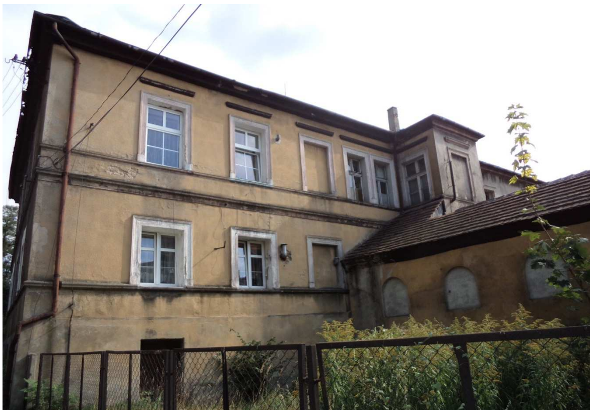
Fot nr 20 Widok elewacji zachodniej.