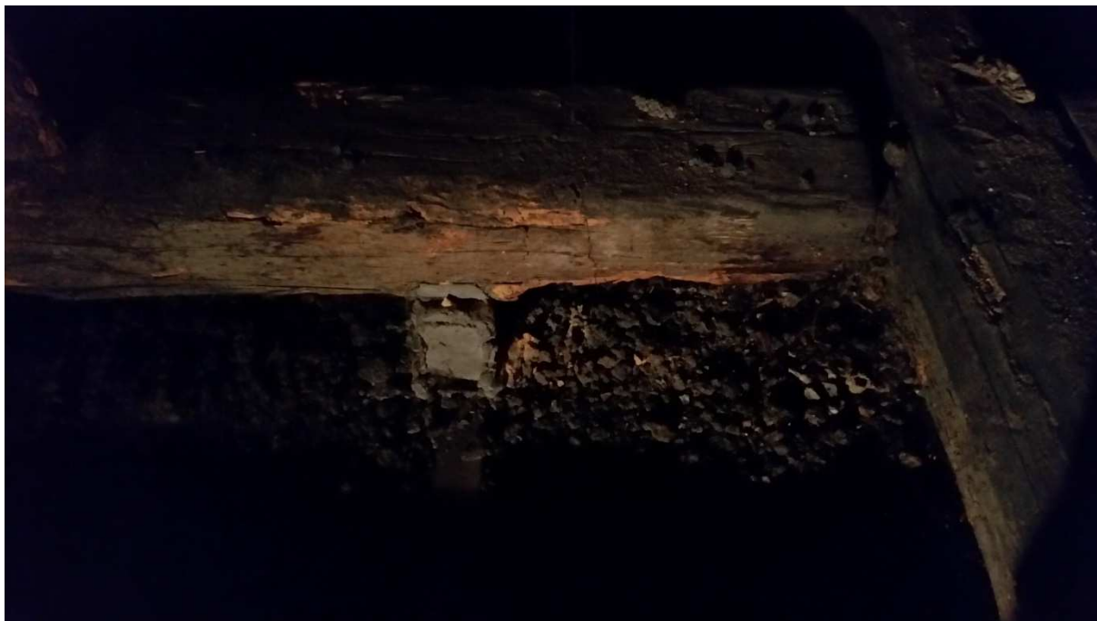
Fot nr 9 Widok skorodowanych biologicznie tram.