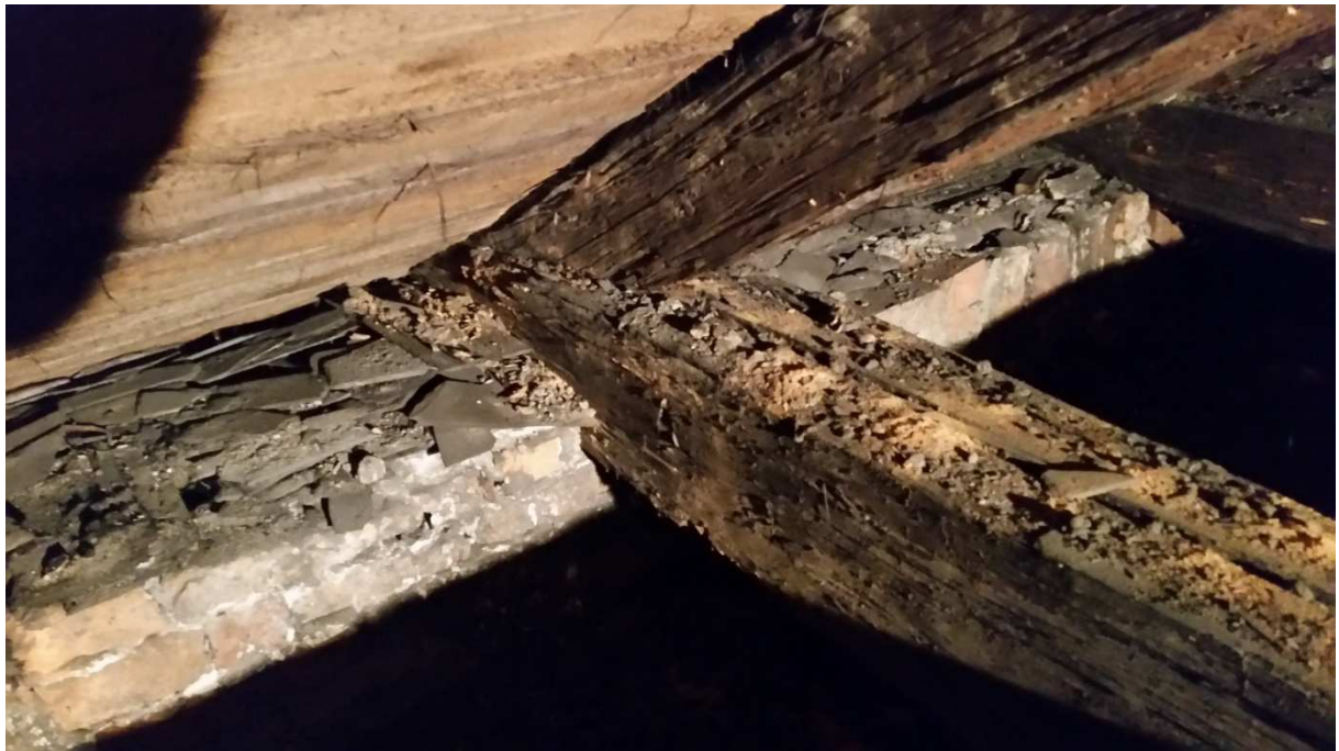
Fot nr 12 Widok skorodowanych biologicznie krokwi i tram.