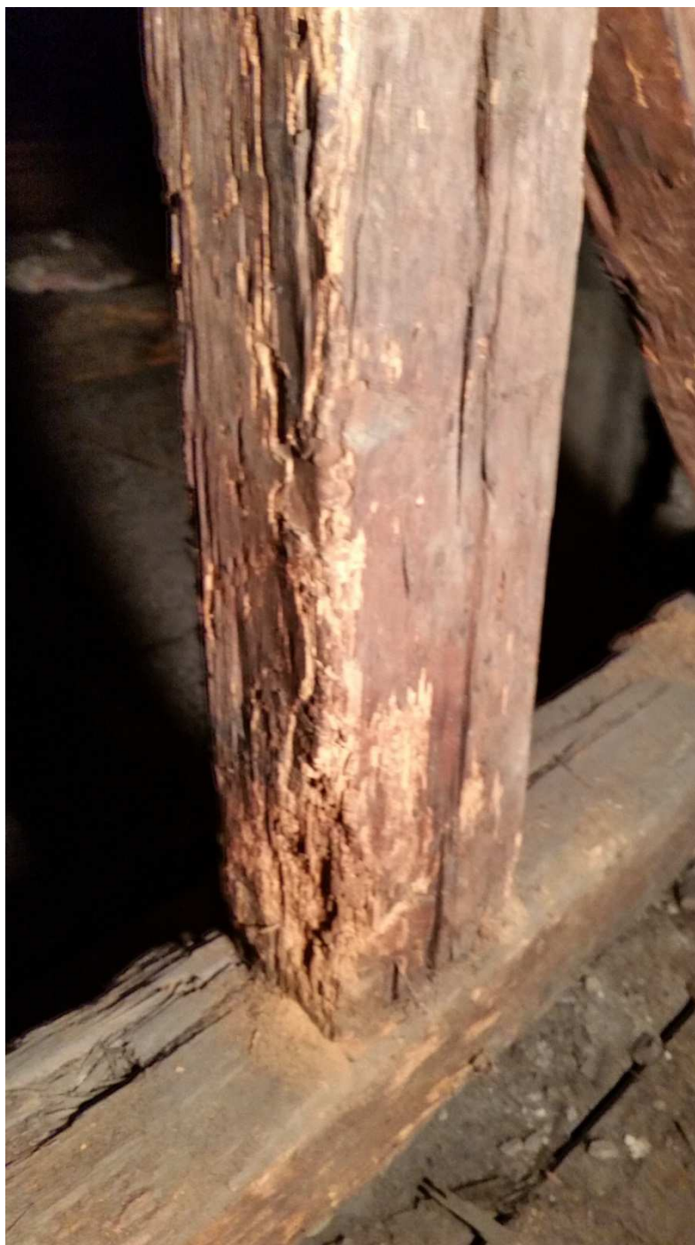
Fot nr 11 Widok skorodowanego biologicznie słupa i belki podwalinowej.