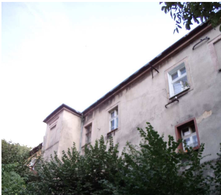
Fot nr 21 Widok elewacji zachodniej.