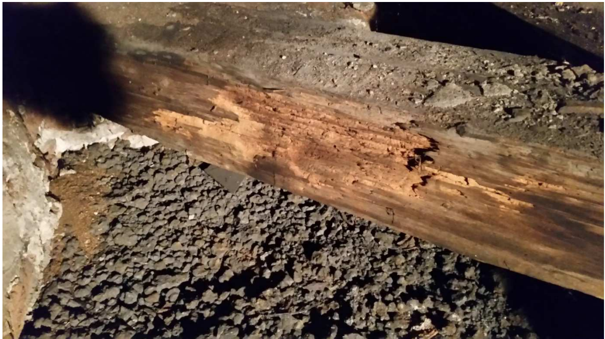
Fot nr 14 Widok skorodowanej biologicznie belki podwalinowej.