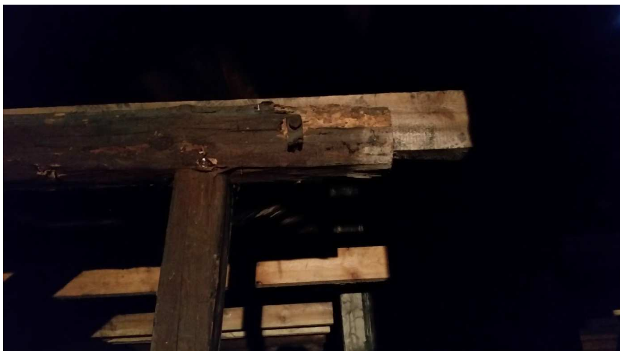
Fot nr 5. Widok istniejącego zabezpieczenia wyciętej jętki.