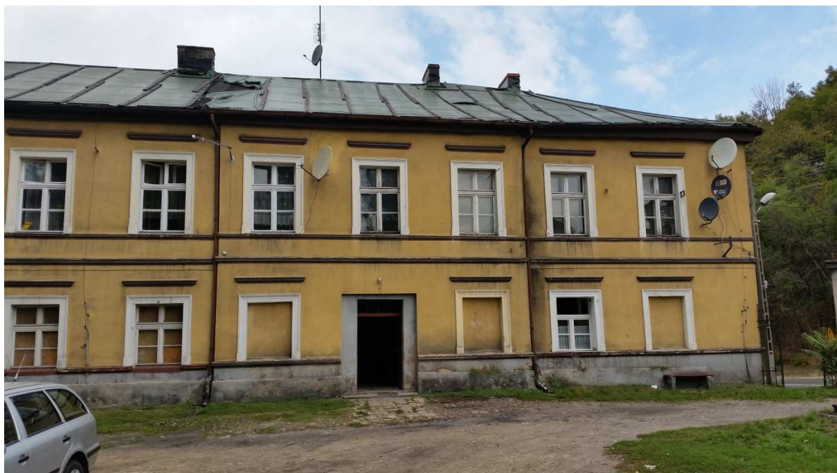
Fot nr 16 Widok elewacji Wschodniej