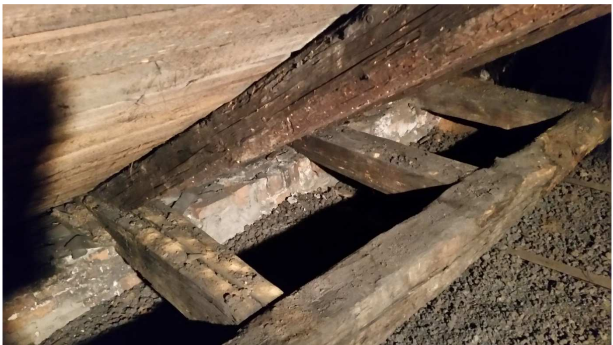
Fot nr 13 Widok skorodowanych biologicznie krokwi i tram.