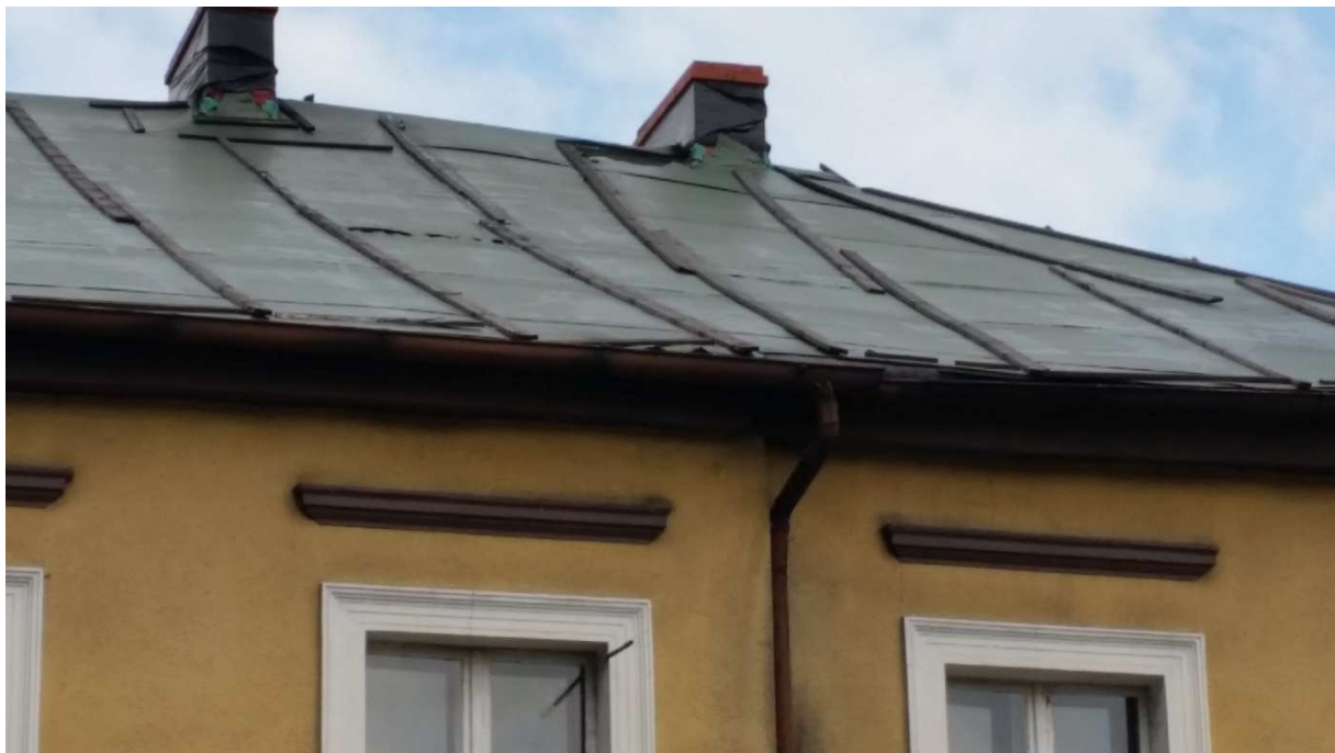
Fot nr 18 Widok ugięcia dachu na elewacji wschodniej.