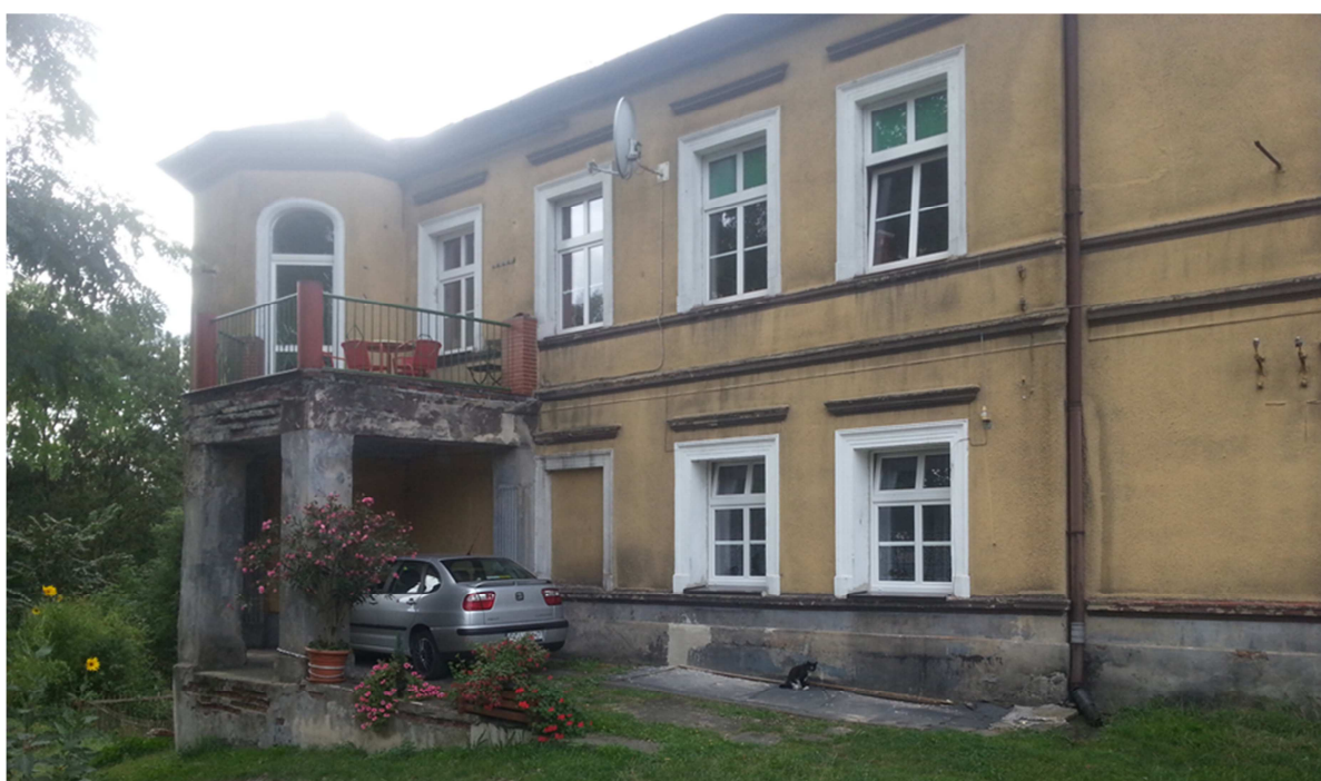
Fot nr 17 Widok elewacji Wschodniej