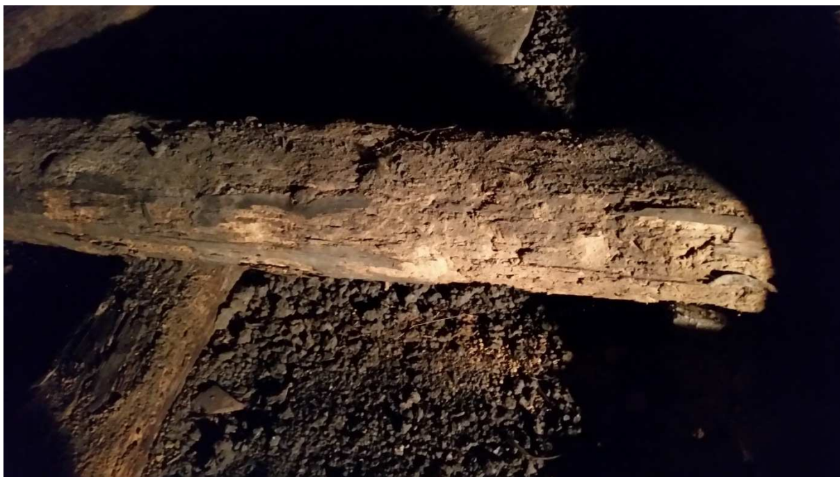
Fot nr 8 Widok spróchniałej belki podwalinowej.