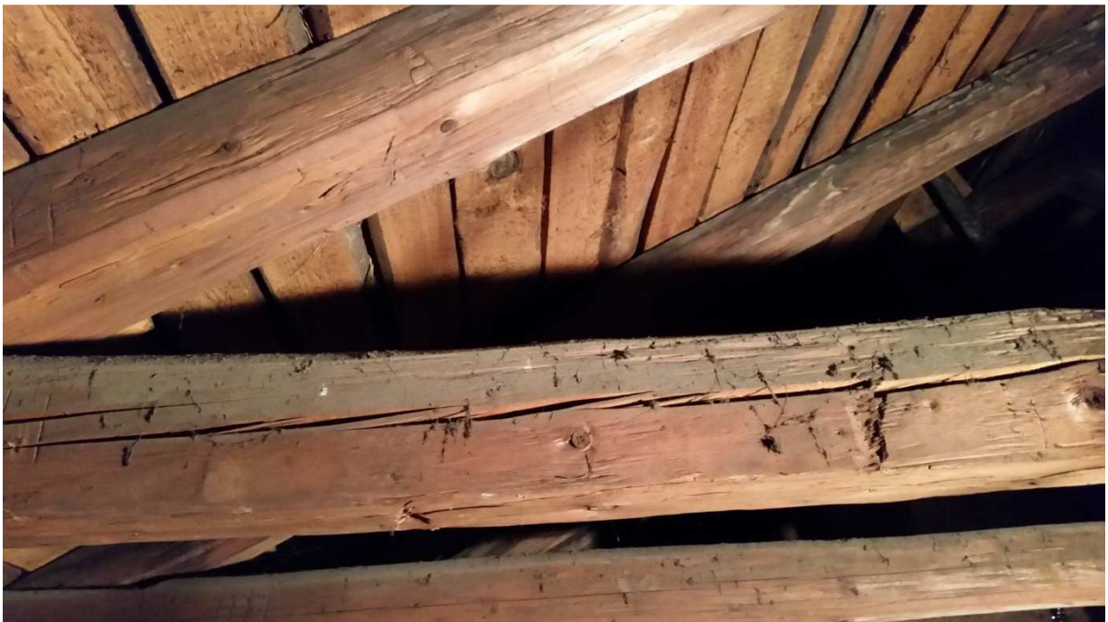
Fot nr 2 Widok spękań jętki.