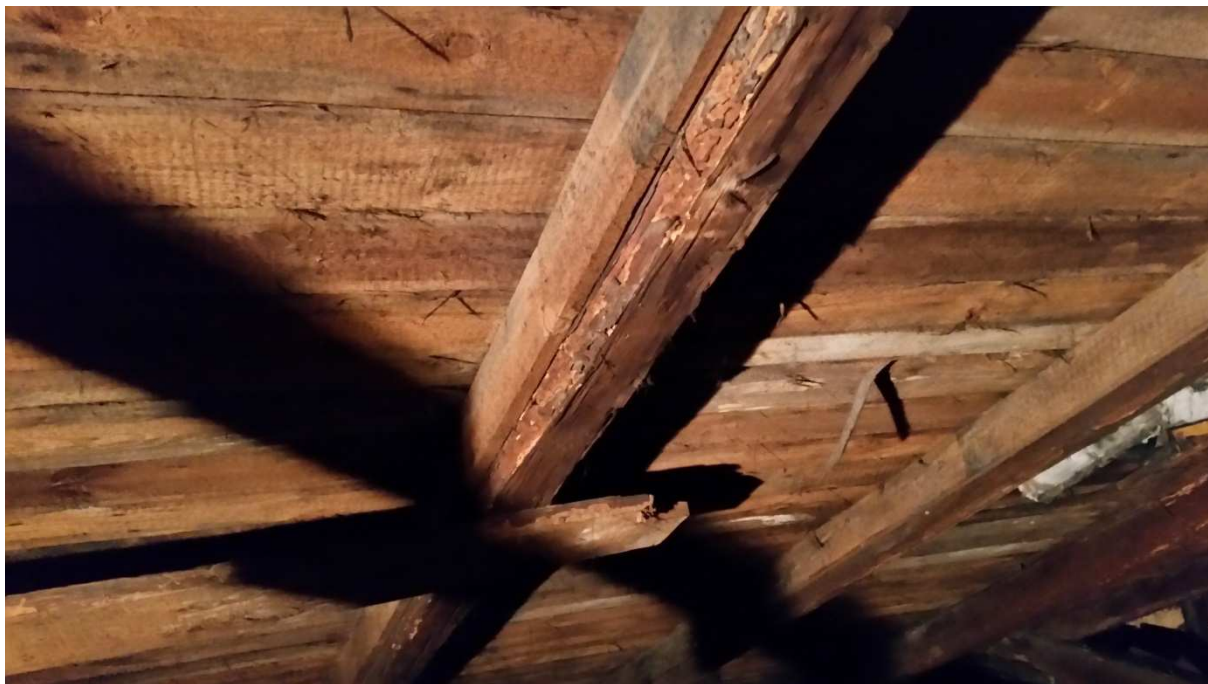
Fot nr 7. Widok istniejącego wzmocnienia krokwi.