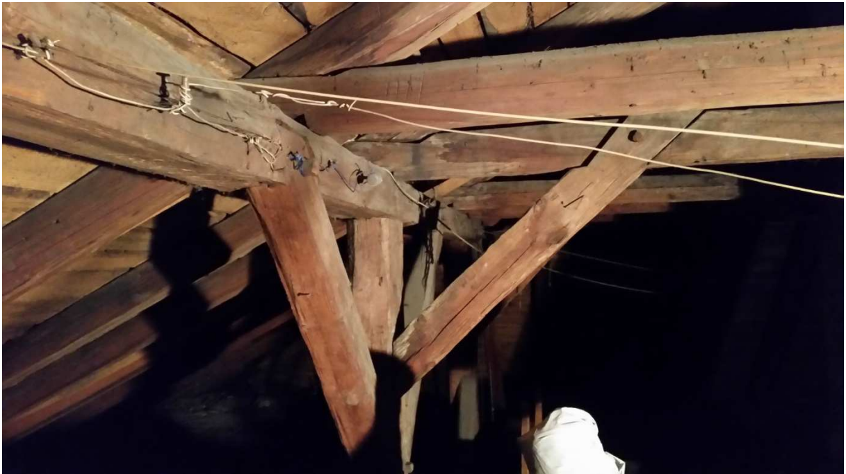
Fot nr 1 Widok połączenia płatwi ze słupem i jętką.